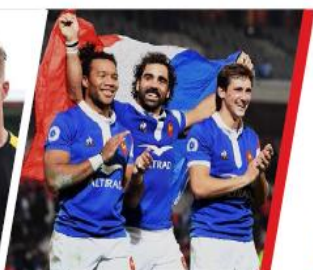
FÉDÉRATION FRANÇAISE DE RUGBY