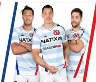
2015 RACING 92