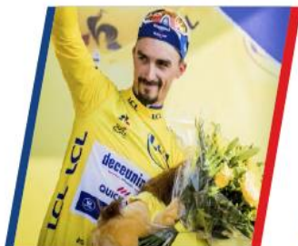
2012 LE TOUR DE FRANCE

RECONSTRUIRE ET MODERNISER NOTRE PATRIMOINE SPORTIF