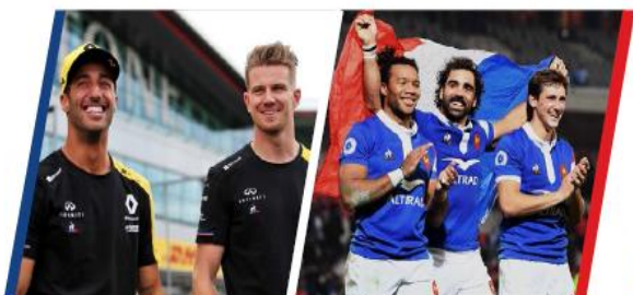
2018 RENAULT F1 TEAM