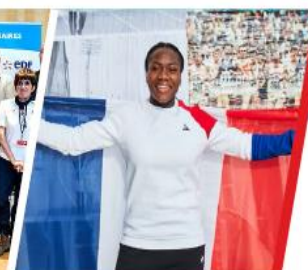
ATHLÈTES OLYMPIQUES ET PARALYMPIQUES