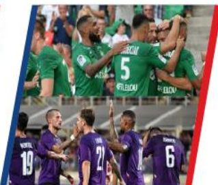
2014 ASSE FIORENTINA