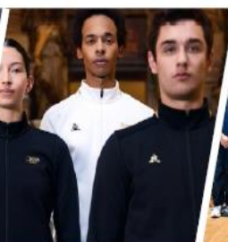
OPÉRA DE PARIS