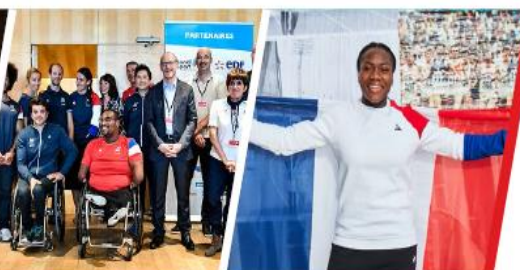
FÉDÉRATION FRANÇAISE HANDISPORT