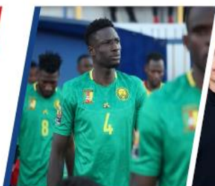
FÉDÉRATION CAMEROUNAISE DE FOOTBALL