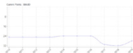
Nombre d'équipes engagées en championnat 2021-2022