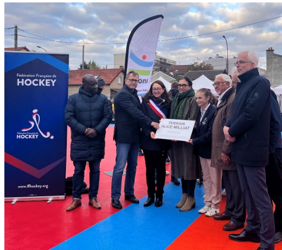
Inauguration du terrain Alice Millat à Bezons (95)