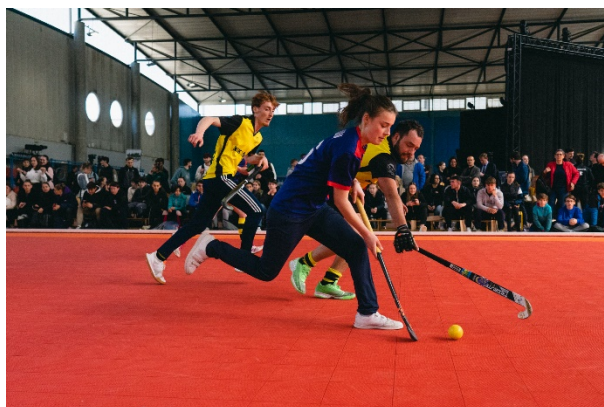
Semaine Olympique à l'Université de Besançon

Acquis en 2022 lors de la campagne "5 000 Equipements de Proximité", la FFH a proposé à chacune de ces ligues de recevoir un terrain mobile de 648m 2 accompagné de bandes, buts et crosses. Les installations/utilisations ont débuté au printemps et se sont poursuivis jusqu'au début de l'hiver sur l'ensemble du territoire.