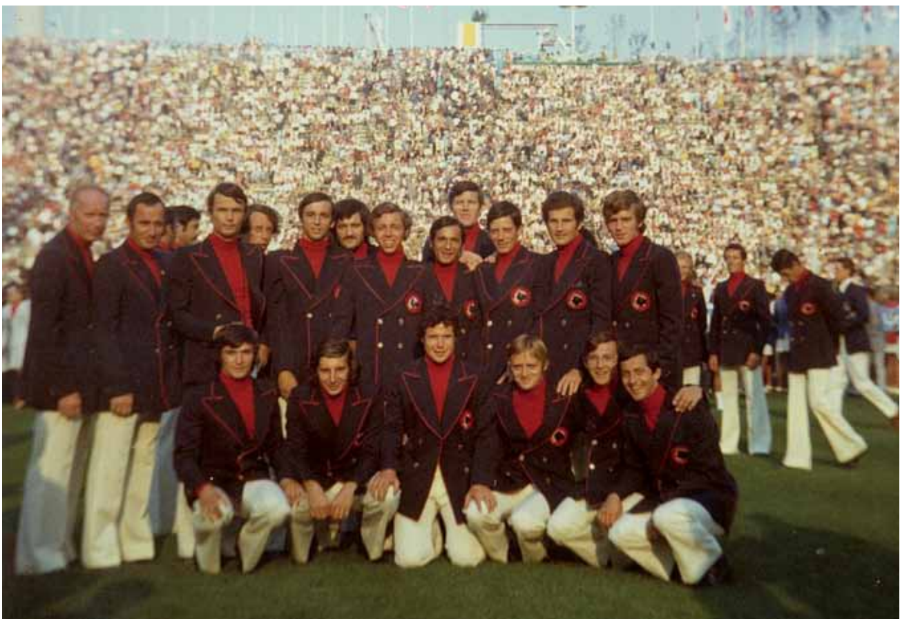
Équipe de France de hockey JO Munich - 1972

Ce groupe de travail aura, parmi ses missions, à identifier et mettre en œuvre le moyen d'« embarquer » dans le Plan « Ambition Hockey 2024 », au sein des Clubs, les joueuses et joueurs de l'élite