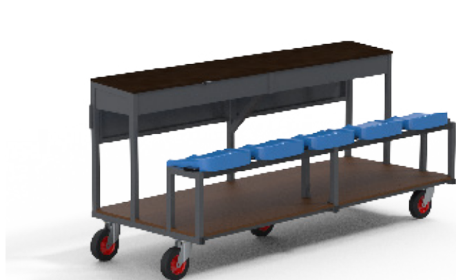
Table de marque pour gymnase. 2.50m pour 5 personnes. Coques plastiques incluses