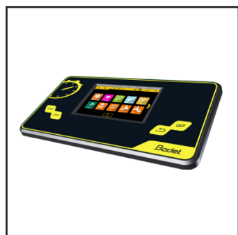
Scorepad - Pupitre tactile, pour tableaux de score électronique