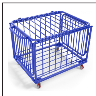
S30532 - Chariot à ballons en acier plastifié bleu. Capacité 20 ballons