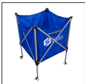
S30530 - Chariot à ballons repliable en aluminium - Capacité 18 ballons